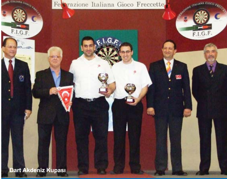
Dart Akdeniz Kupası