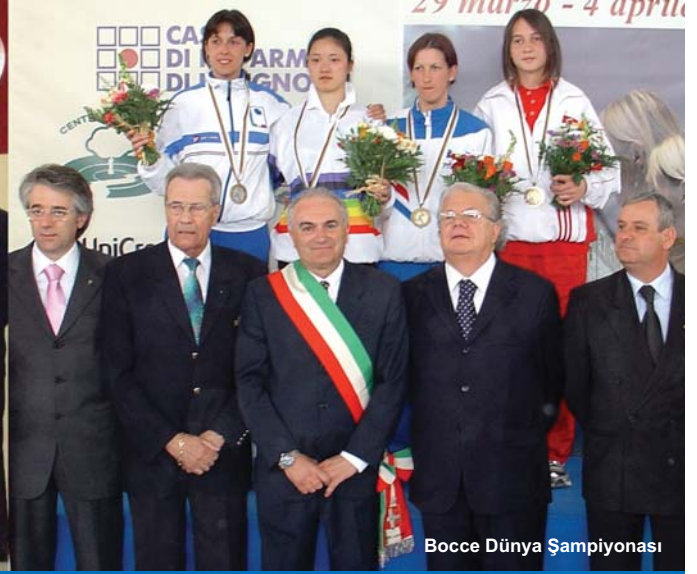
Bocce Dünya Şampiyonası