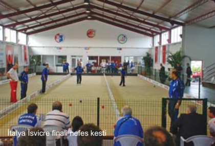
İtalya İsviçre finali nefes kesti