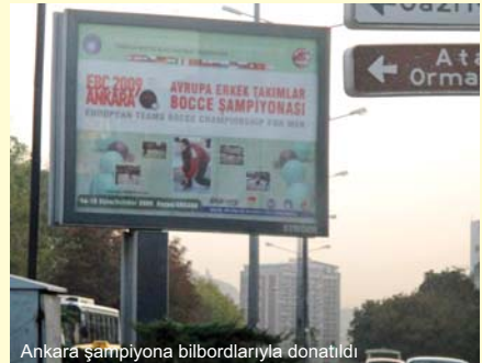
Ankara şampiyona bilbordlarıyla donatıldı