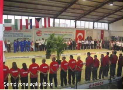
Şampiyona açılış töreni

Salonun açılışını müteakip şampiyonanın açılış törenine geçildi. Törende takımların geçişinin ardından, takımlar tanıtılırken, ülkelerin milli marşları da dinlendi. Milli marşımız okunurken seyircilerin hep birden coşkuyla marşa eşlik etmesi salonda büyük bir alkış aldı.