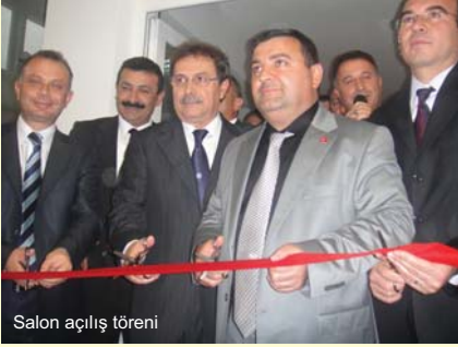
Salon açılış töreni