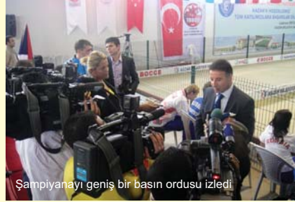
Şampiyonayı geniş bir basın ordusu izledi

Avrupa Şampiyonasında kötü bir kura çeken milli takımımız, İsviçre ve Rusya ile aynı gruba düştü. İlk maçta Rusya ile karşılaşan takımımız, üçler maçını şanssız bir biçimde kaybedince işi zora soktu. Teklerde milli takım galibiyeti olarak durumu eşitlese de, çiftler maçında mağlup olunca karşılaşmayı 2-1 yenik kapadı. İkinci maçında şampiyonanın seri başı takımlarından İsviçre karşısında varlık gösteremeyen takımımız, maçı 3-0 kaybederek evinde oynadığı şampiyonada çeyrek final dışında kaldı. Klasman maçlarında ilk olarak Çek Cumhuriyeti ile eşleşen ve bu maçı 3-0 kazanırken, daha sonra 9nculuk maçında KKTC'yi 2-1 mağlup ederek, şampiyonayı 9. sırada tamamladı.